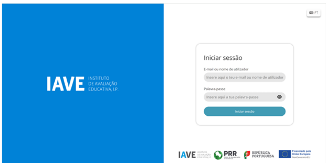
Figura 1 – Acesso à Plataforma de Realização de Provas do IAVE

c) Inserir as credenciais “Nome de utilizador” e “Palavra-passe” e, em seguida, clicar em “Aceder” ou “Iniciar sessão”.